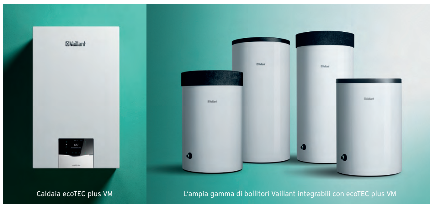
Caldaia ecoTEC plus VM

Tecnologicamente le innovazioni riguardano: il nuovo blocco termoidraulico, rinnovato nel design e migliorato nelle performance, la tecnologia IoniDetect per un controllo puntuale del gas impiegato e il sensore di temperatura dell'acqua sanitaria, tutto per garantire il miglior comfort sanitario di sempre.