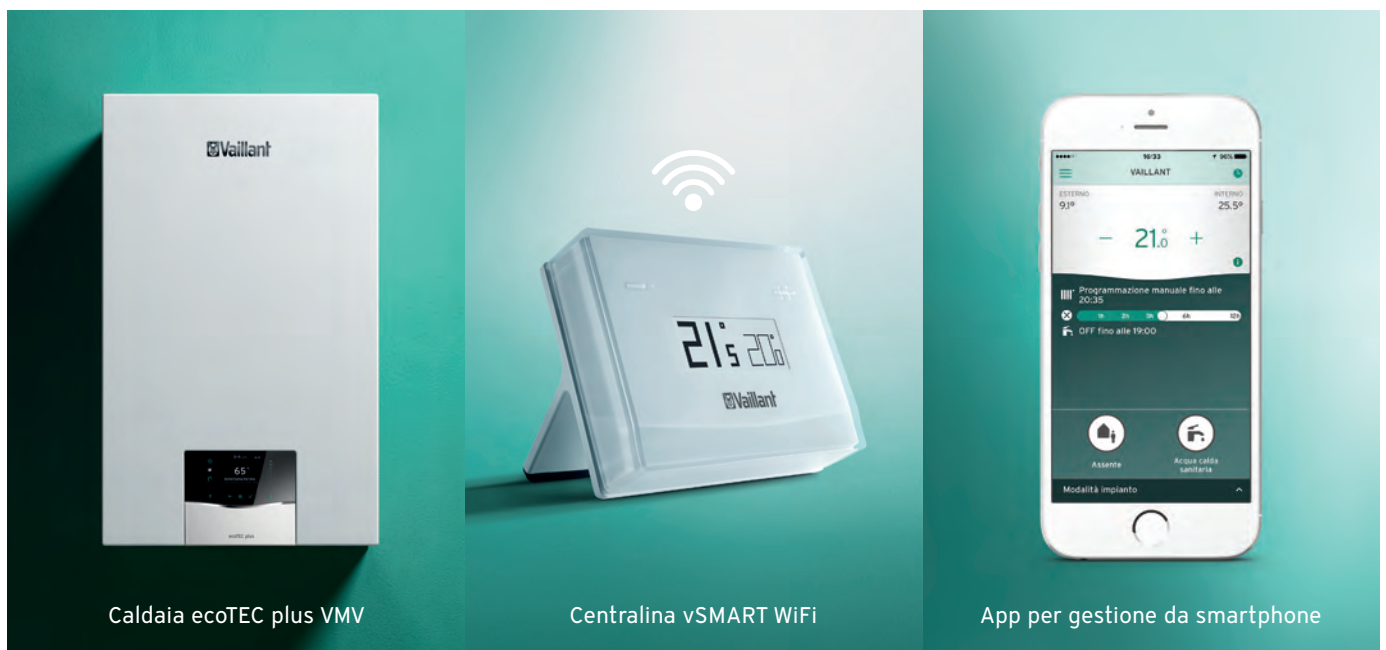
Caldaia ecoTEC plus VMW

I più attenti potranno anche contare su dati utili e di facile lettura per impostare una "strategia" di comfort termico più efficiente e razionale.